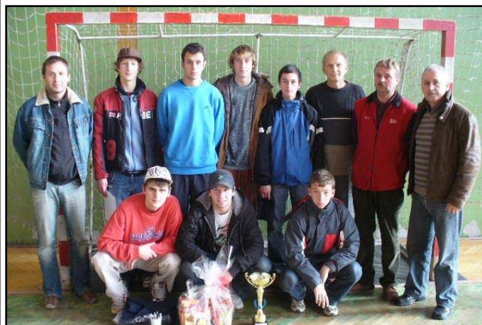
* Víťazné družstvo usporiadateľskej Spojenej školy z Martina