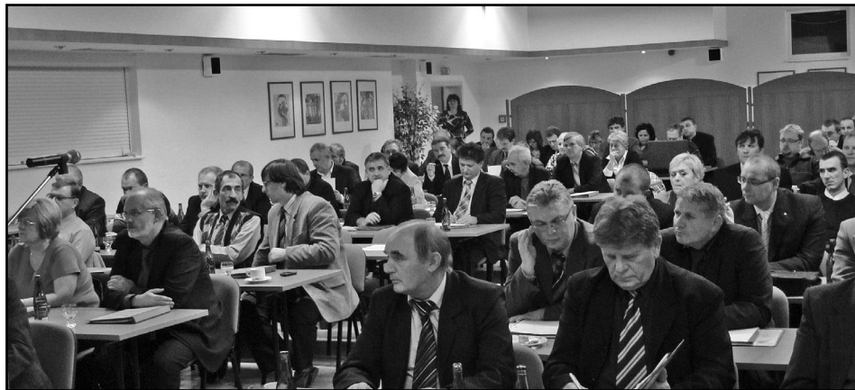
• Delegáti zlučovacieho zjazdu.